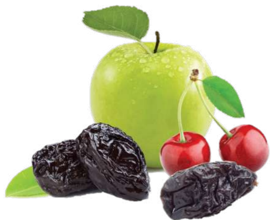
PRUIMEN - APPELS - KERSEN

HET AANTAL EN DE KWALITEIT VAN SMAAKPILLEN NEEMT AF MET DE LEEFTIJD, WAT RESULTEERT IN SMAAKVERLIES.